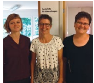
Team Fachstelle Breitenbach