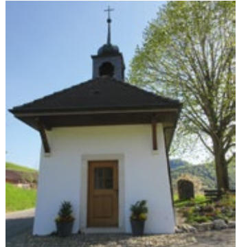
Kapelle St. Wendelin

Die Kirchgemeinde Bärschwil gehört dem Pastoralraum Thierstein an. Die Kirche ist dem Heiligen Lukas geweiht, Patrozinium ist am 18. Oktober. Die Kirche wurde 1548 im Stil der Spätgotik errichtet und 1727 sowie 1928 umgestaltet.