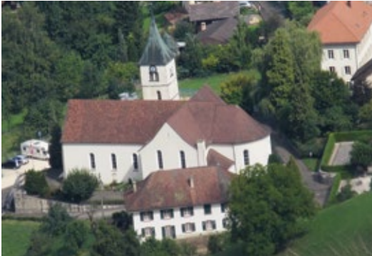
Kirche St. Lukas